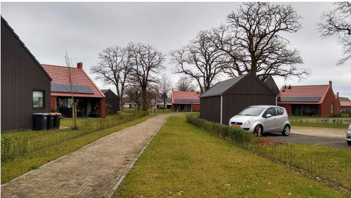
Ruime opzet op een groen laken en de grens tussen privé en openbaar, alleen gemarkeerd door hagen.