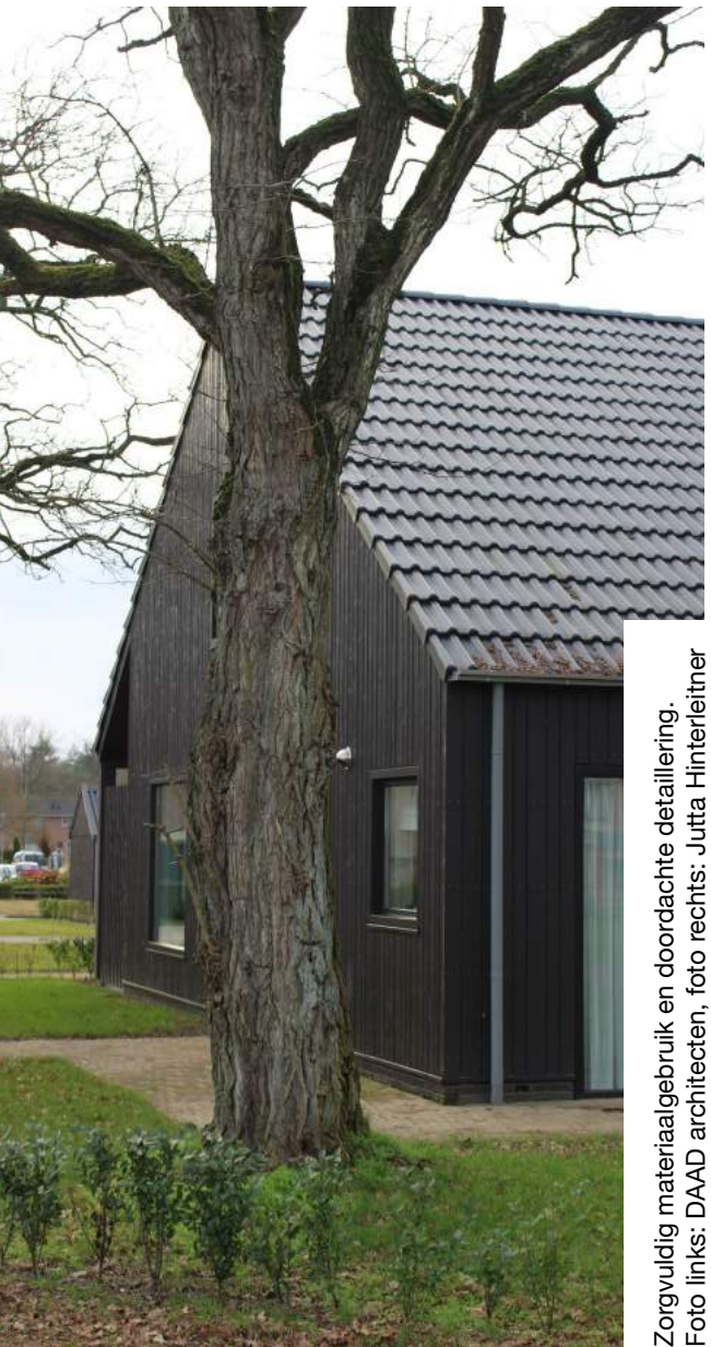
Zorgvuldig materiaalgebruik en doordachte detaillering.

meer mensen op zoek naar woningen in de regio', licht Klasen telefonisch toe. 'Daarom zetten we in Schoonoord nu in op een nieuwe, integrale dorpsvisie, die we samen met Woonservice en de dorpsbewoners gaan uitwerken. Hoe kunnen we ouderen verleiden om naar kleinere woningen te verhuizen, zodat grotere woningen vrijkomen voor jonge of nieuwe bewoners? Ons doel zijn toekomstbestendige dorpen door verduurzaming van de bestaande woningvoorraad en de bouw van levensloopbestendige woningen.'