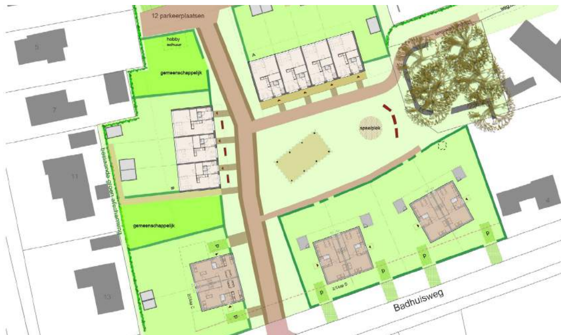
Nei Arf: situatie en gezamenlijk erf met kapschuur. Voordeuren komen uit op de openbare ruimte.

steen zie je overal in de omgeving terug. Het project is qua dichtheid, typologie en bouwhoogte goed aangepast aan de dorpsomgeving.' Jager, half schertsend: 'Ja, in de dorpen bouwen we laag. Een gebouw van meer dan twee verdiepingen noemen we al hoogbouw.' De Jong: 'Als we bij Studionine dots aan doorontwikkeling werken, proberen we een "extra laagje" toe te voegen, bijvoorbeeld in de vorm van een iets hoger gebouw als accent. Daarmee kun je ook het aantal woningen in een plan iets verhogen.' Maar volgens Jager was dat in deze context qua gewenste woningaantallen niet nodig. De Jong vervolgt: 'Heel belangrijk voor het