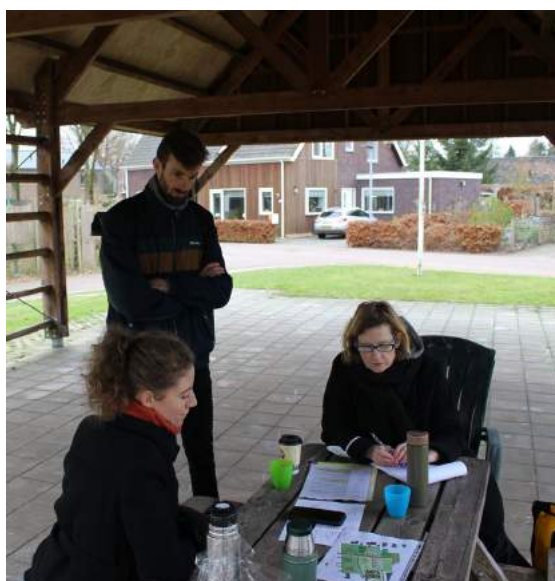
Op werkbezoek in Drentse dorpen

Bij het thema toekomstbestendige ontwikkeling gaat het meestal om de stad. Een veel besproken strategie is verdichting: het slimmer, compacter en veelzijdiger gebruiken van de bebouwde kom, zodat het nu nog onbebouwde gebied ook onbebouwd kan blijven en zo ruimte biedt voor natuur, landschap en recreatie. Maar doorontwikkeling is ook een dorpse opgave. Dat gegeven blijft echter onderbelicht. Om dit te veranderen, organiseerden het Stimuleringsfonds