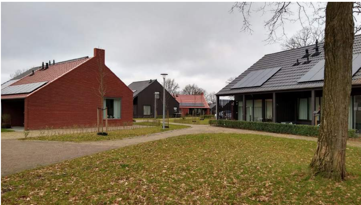
Afwisseling en ruimtelijke diepte door zorgvuldige plaatsing van gebouwen.