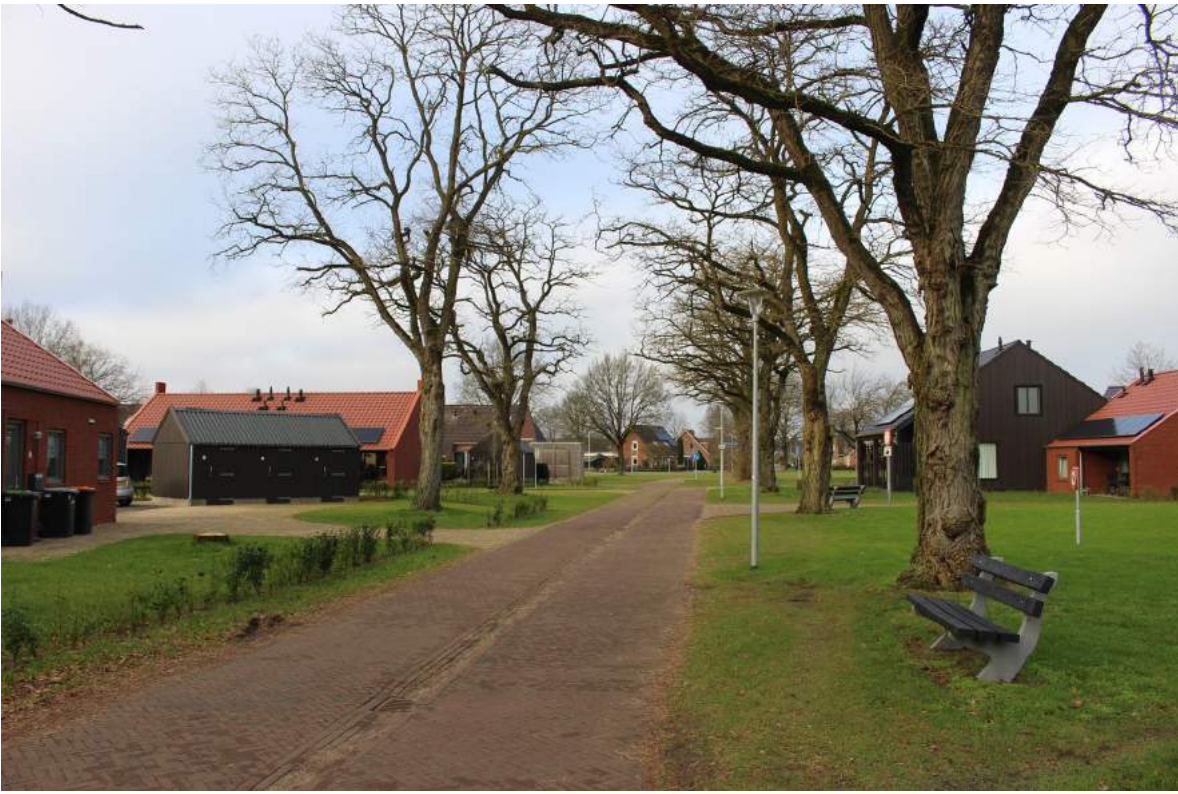
Brinkwonen: situatie en aansluiting op bestaande structuren door de vormgeving van de weg, het behouden van oude bomen en 'gestrooide' bebouwing.