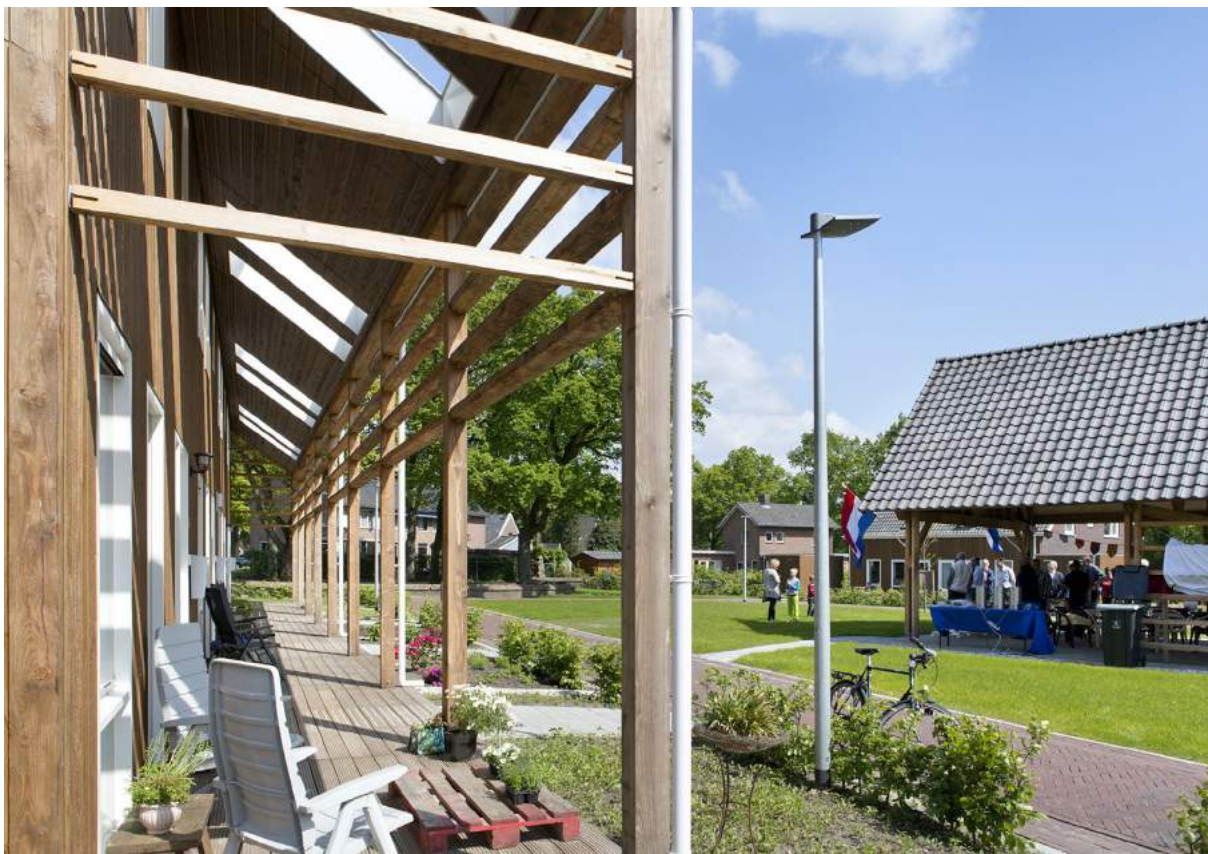
De veranda's als ambivalente, activerende tussenzone. Foto: DAAD architecten

Op enkele kilometers afstand van Exloo ligt Schoonoord (Gemeente Coevorden). Ondanks de ruimtelijke nabijheid zijn historische en ruimtelijke context hier geheel anders. Schoonoord is in 1854 na aanleg van het Oranjekanaal gesticht als een