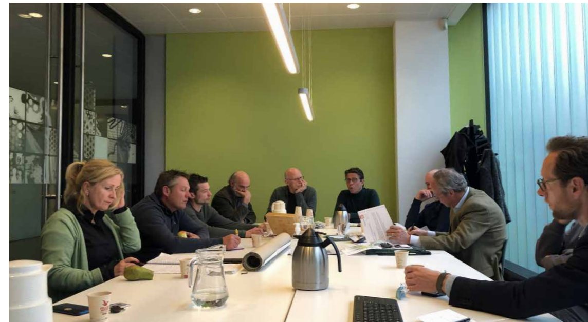
De eerste Landschapstafel over Agrarisch Natuurbeheer

Uitgangspunt voor de gemeente Oss was dat de agrariërs centraal komen te staan in een nieuw samenwerkings- en co-creatieproces. In een eerste fase hebben we gewerkt aan een vertrouwensbasis en heldere uitgangspunten. Daarna hebben we drie landschapstafels georganiseerd rondom thema's die de melkvee-houders hebben gekozen en uitgewerkt. Aan de landschapstafel schoven gemeente, waterschap en provincie aan. Met ontwerpend onderzoek creëerden we een perspectief op landbouw-ontwikkeling en participatie.