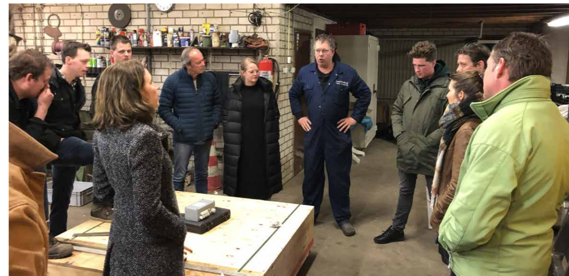
De tweede Landschapstafel inclusief excursie 'mestverwerking naar kunstmestvervanging'.