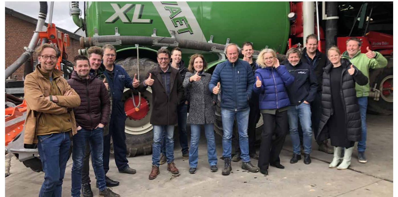
Alle betrokkenen zijn enthousiast en willen graag door met het project