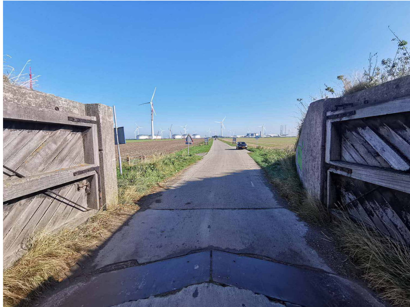
Zicht op de Oostpolder

'Biodiversiteit staat niet haaks op 'exploitatie' en 'ondernemen', maar maakt er integraal en onlosmakelijk onderdeel van uit.'