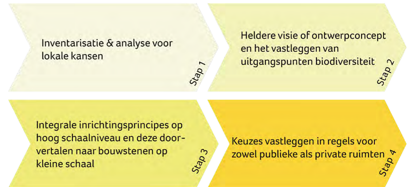
Stappenplan biodiversiteit Biodiversiteit maakt integraal en onlosmakelijk onderdeel uit van de zo gewenste, duurzame wereld van morgen. Het stappenplan om biodiversiteit als volwaardig onderdeel mee te nemen in de planvorming ziet er op hoofdlijnen als volgt uit.

'Uiteindelijk gaat de natuur zijn eigen gang. Beweeg dus mee als blijkt dat de natuur zich anders ontwikkelt dan bedacht.'