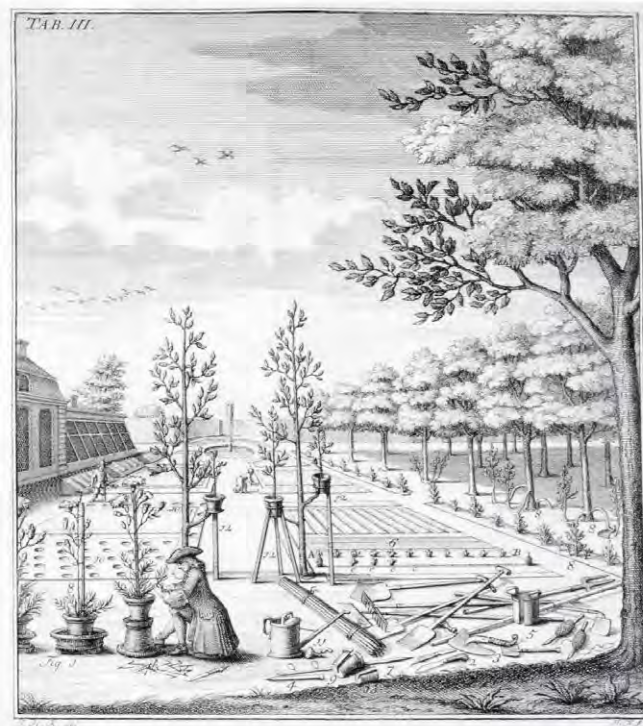
Stadskwekerijen Sierteelt door de eeuwen heen.

Ze dragen meerdere suggesties aan die van deze achterkanten voorkanten maken en ze 'activeren'. Bijvoorbeeld door muurschilderingen, ontmoetingsplaatsen, kwekerijen, vergroenen of woningbouw. Toepassen van circulariteit kan het realiseren van tijdelijke toevoegingen vergemakkelijken. Bijvoorbeeld door deze verplaatsbaar te maken of de gebruikte materialen elders in de binnenstad te benutten.