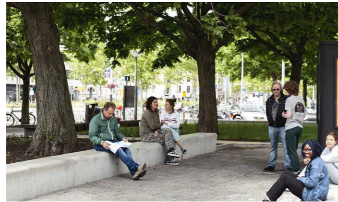
Cygnus Park om de Hoek, aangelegd in 2018