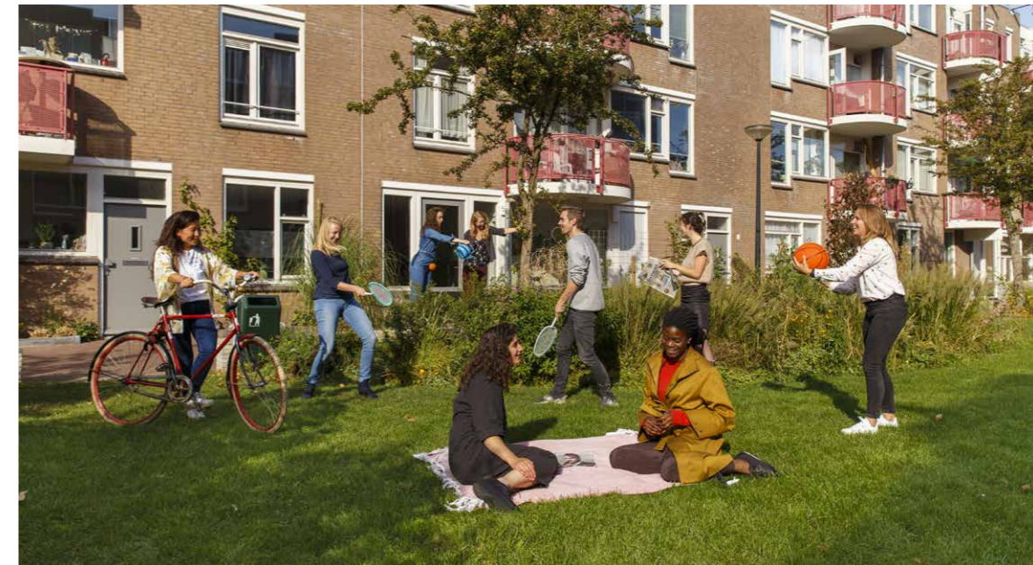
Het consortium in Minahassa Park om de Hoek.

Samen met een sterk consortium van bewoners, gebiedsmakelaars, groen-coaches en buurtorganisaties ontwikkelden we het proces voor Park om de Hoek 2.0. We zetten in op het zo veel mogelijk empoweren , inspireren en waar nodig ondersteunen van bewoners, buurtorganisaties en buurtgroen coaches. Om met Park om de Hoek 2.0 een bijdrage te kunnen leveren aan grootstedelijke opgaven, zoals klimaatverandering en segregatie, is het belangrijk dat we hierover al vanaf de start met elkaar in gesprek gaan en deze opgaven meenemen.