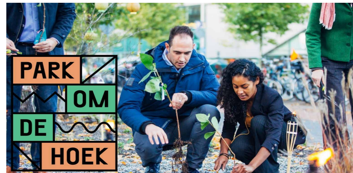
Opening Ruyschtuin Park om de Hoek, 2017