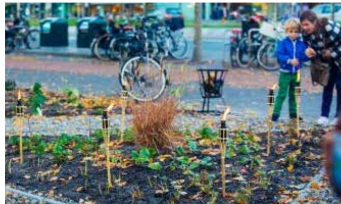
Ruyschtuin Park om de Hoek, aangelegd in 2017